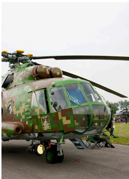
3 Słowacki Mi-17

terrorystycznym się robi. Jeśli chodzi o możliwość wniesienia broni czy materiałów wybuchowych - obawiam się, że nie nastąpiłoby żadnego problemu.