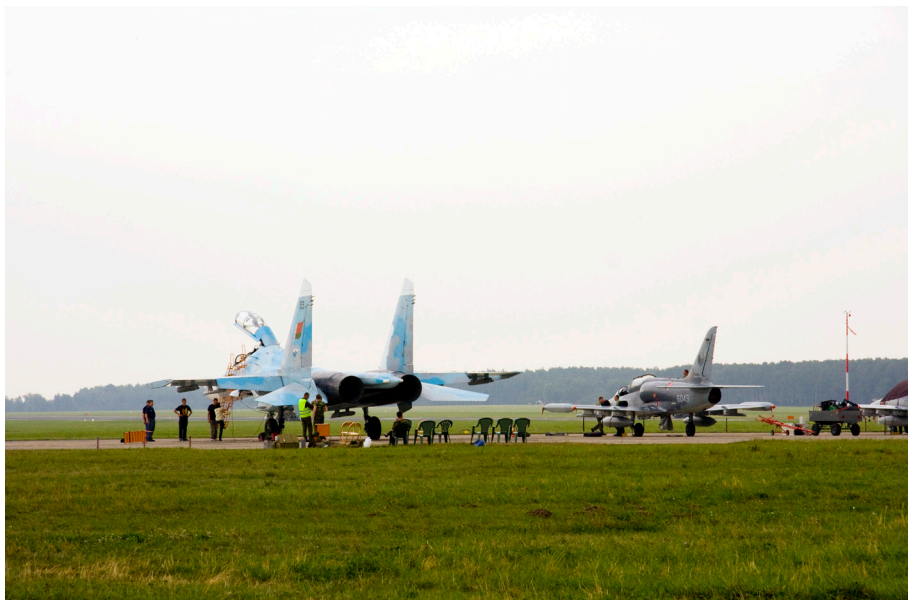
Białoruski Su-27UB to samolot, na którego obecność na pokazach w Polsce czekało wielu miłośników lotnictwa. Radość z jego przylotu nie trwała jednak długo...