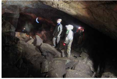
Plener w jaskini w Jaworzni