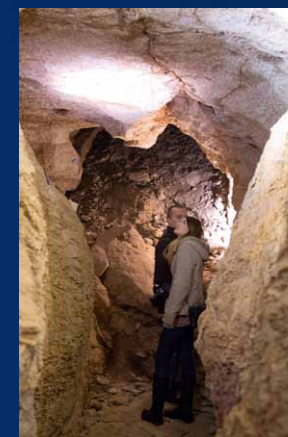
Plener w jaskiniach na Kadzielni