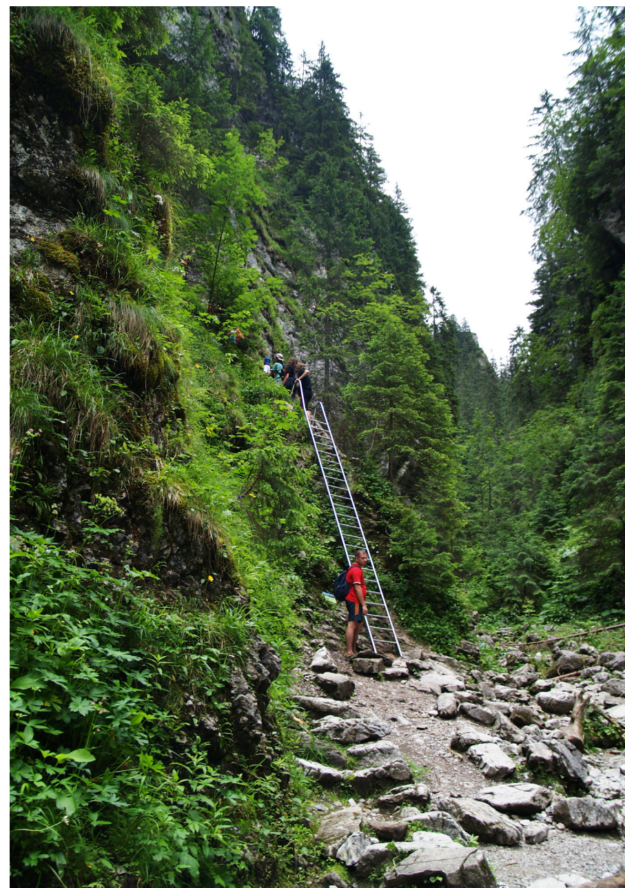
Wejście do Smoczej Jamy