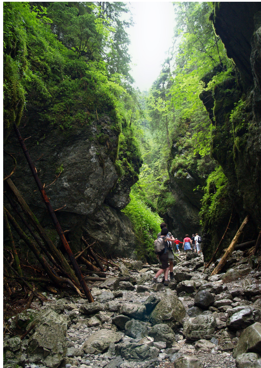
Patyki i kije pozostawiane przez turystów

Jest to trasa dla osób rozpoczynających pobyt w Tatrach, na tzw. rozgrzewkę bądź dla tych, którzy bez większego wysiłku chcą poczuć klimat gór. Do jej przebycia nie potrzeba dobrych warunków atmosferycznych, więc dla wielu jest to opcja na deszczowy dzień, kiedy nie da się wyjść wyżej. Po trasie rozsiane są w kilku miejscach ławki, a płynący obok Potok Kościeliski często nawet w godzinach popołudniowych pokrywa warstwa mgły, która tworzy klimat tego miejsca. Jedynym mankamentem są kolonie oraz liczne wycieczki, które tłoczą się na drodze do schroniska.