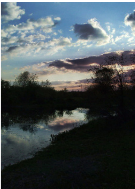
Zachód Słońca sfotografowany nad jednym z rozlewisk Wisły w okolicach Pieprzówek