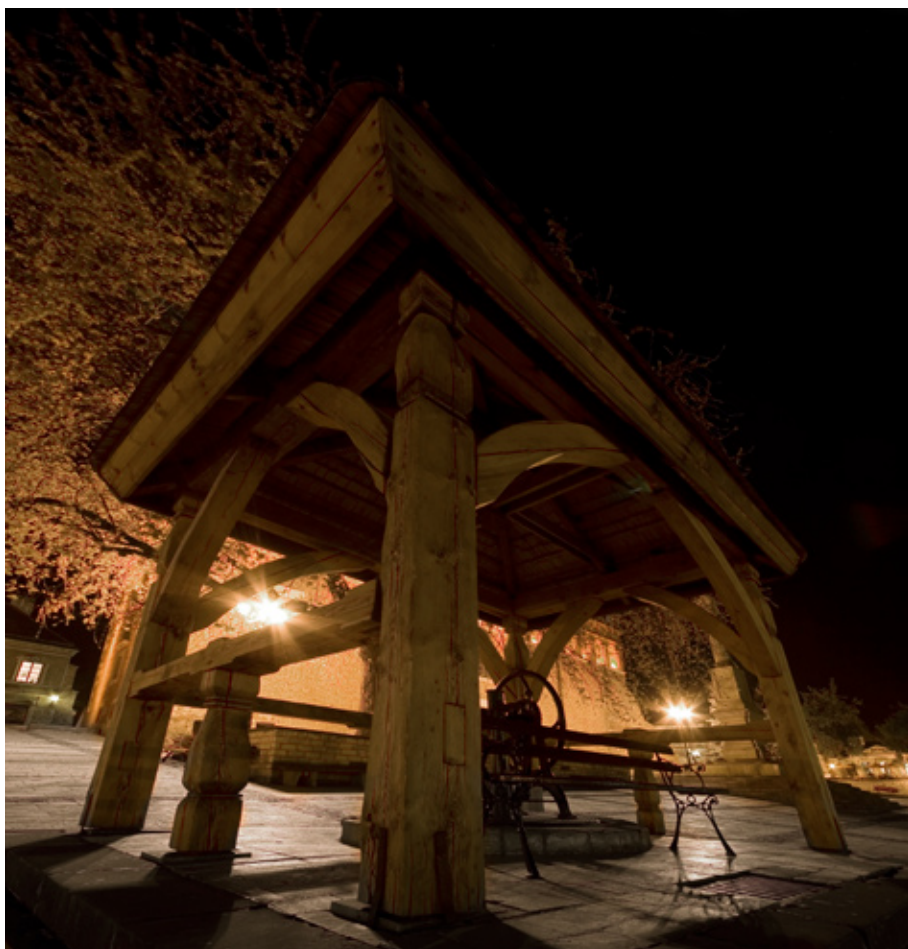
Studnia na sandomierskim rynku

dzikich róż. Miłośnicy makrofotografii nie będą zawiedzeni, zwłaszcza w słoneczne dni, gdy zbocza Pieprzówek są doskonale oświetlone.