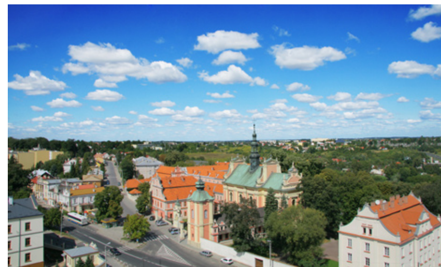
Dwa zdjęcia wykonane z tarasu widokowego na szczycie Bramy Opatowskiej