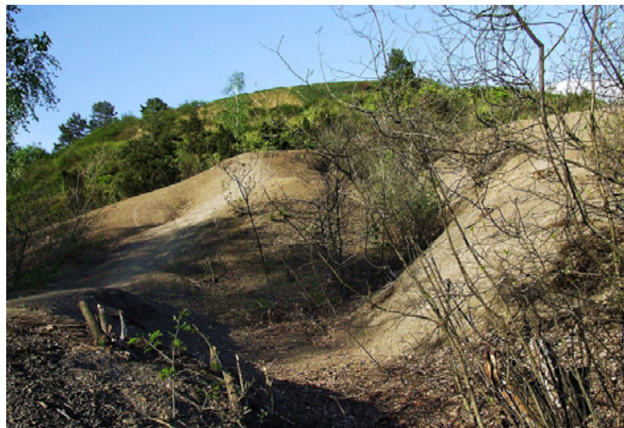
U góry - widok z Pieprzówek na Wisłę i jej rozlewiska. Dolne zdjęcie przedstawia charakterystyczny, pagórkowaty krajobraz Gór Pieprzowych