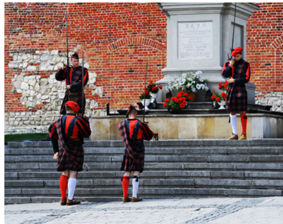
Uroczystość zmiany wart

nauczycielka tłumaczyła na czym polega ruch międzycząsteczkowy. Kazimierz odwiedziłem dwa razy - roił się od producentów pseudoartystycznych czarno-białych zdjęć zalewających oglądającego brzydota i brudem. Widziałem między innymi jegomościa w jasnych kraciatych portkach i stylizowanym na ludowy kapeluszu robiącego nocą, bez statywu zdjęcie aparatem dwuobiektywowym. Osobnika wkładającego głowę do ulicznego kosza by zrobić makro niedopałka papierosa nawet nie chce pamiętać.