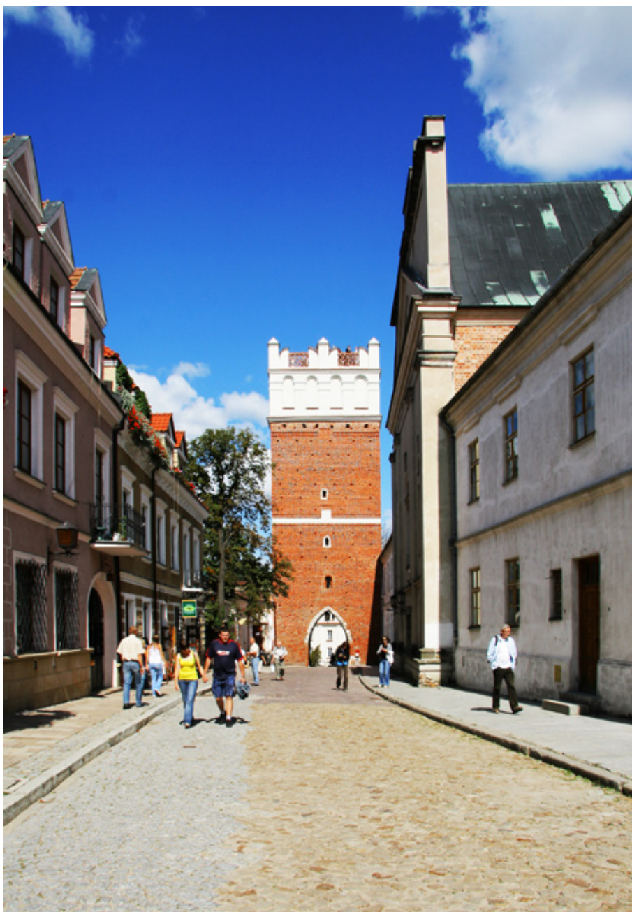
5 Jeden z najbardziej znanych zabytków Sandomierza to Brama Opatowska.

być więc problemem. Za dnia można skorzystać z okazji i wspiąć się na taras widokowy na szczycie bramy - widok trochę utrudniają elementy wieńczące budynek, ale mimo to da się sfotografować panoramę Sandomierza. Jeśli chcemy robić zdjęcia sąsiednich obiektów przyda się teleobiektyw.