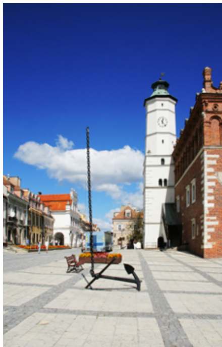
Katedra oraz rynek z ratuszem to kolejne popularne atrakcje miasta

w innych miastach). Rynek jest zadbane, tematów do zdjęć nie zabraknie, no chyba, że ktoś jest miłośnikiem cierpiętniczych zdjęć odrapanych podwojek - tu może być problem, bo jak na złość cała okolica jest czysta i dokładnie sprządana a same kamienice w przeważającej większości wyremontowane i dobrze utrzymane. Większość budynków powstała w XV-XVII wieku - różnią się układem przestrzennym i detalami architektonicznymi. Jedną z atrakcji rynku jest zabytkowa studnia, w jej pobliżu znajduje się wbita w bruk kotwica z łańcuchem wymierzonym w niebo. Wadą są niestety ogródki piwne okolicznych kawiarenek poustawiane w kilku miejscach - parasole osłaniające stoliki mocno przeszkadzają w fotografowaniu zabytków, a uroku zdjęciom nie dodają. Niestety tego typu „ozdoby” stały się cechą charakterystyczną prawie każdego atrakcyjnego turystycznie miejsca w naszym kraju. Problem znika w chłodnych porach roku - jesienią para-