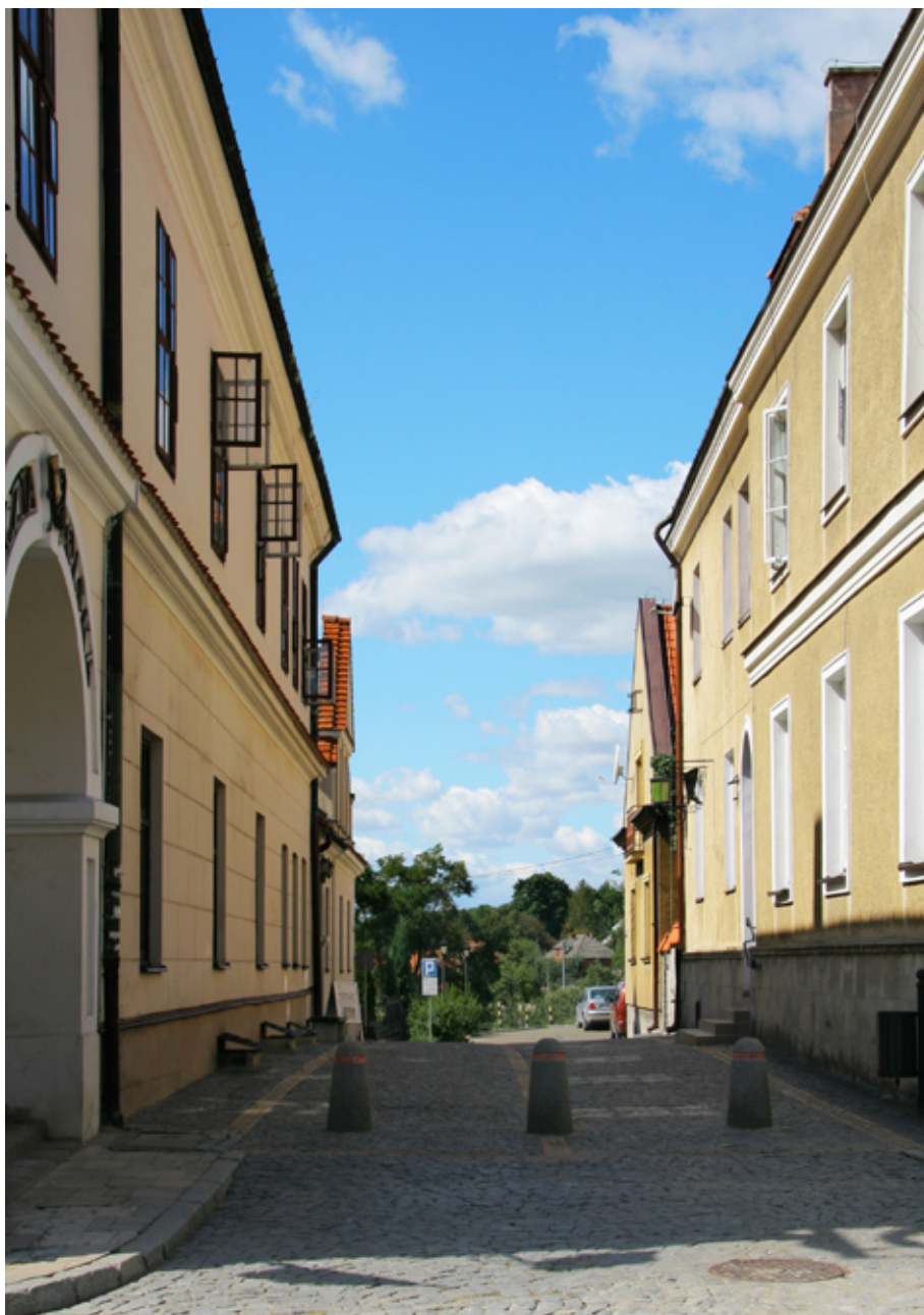
Jedna z bocznych uliczek sandomierskiej starówki. Wyremontowane i czyste fasady budynków są niewątpliwym atutem miasta.