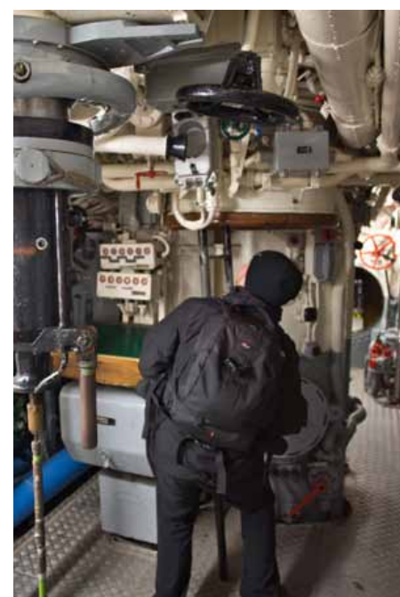
Kuchnia, a poniżej koje.