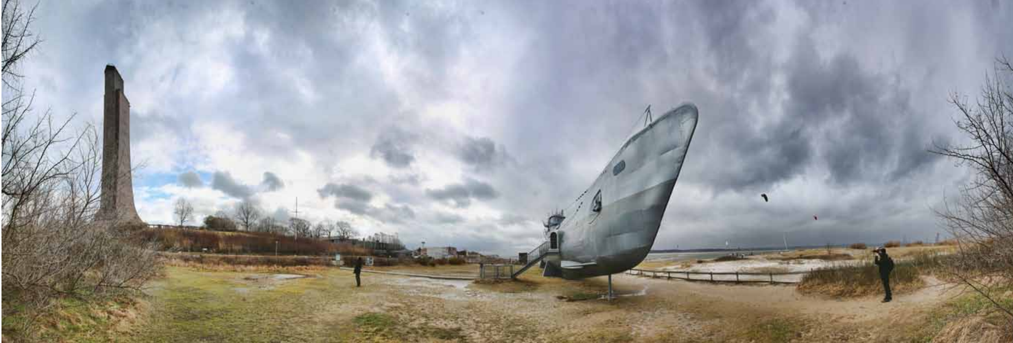
Plaża, U-Boot i Mauzoleum