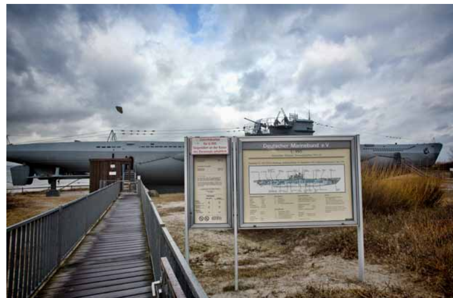
Wejście do U-Boot'a

tografii detali. Niestety ciężko fotografować w ciasnych pomieszczeniach, gdy pozostali turyści chcą iść dalej i nie ma możliwości blokowania przejść. My obeszliliśmy cały okręt, każde z jednym obiektywem - 20 i 35 mm. Luty nie jest szczytem sezonu więc na szczęście zwiedzających było niewiele. Deszczowa pogoda nie pozwoliła na długi ple-